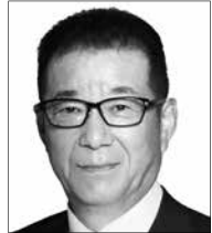
代表 松井 一郎