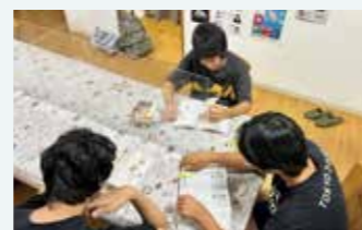
▲児童養護施設の子どもの様子