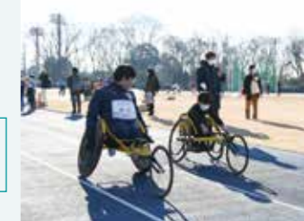
▲車いすレーサー体験

誰もが使いやすいスポーツ施設の整備や、パラスポーツをはじめとするスポーツ・レクリエーション活動への支援に取り組んでいます。