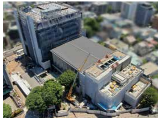
▲建設中の区役所本庁舎と区民会館

いただいたご寄附は、様々な人が快適で使いやすい施設としての整備や、区民の参加と協働・交流を推進するスペースの拡充、大沢昌助氏デザインのレリーフの再生費用など、本庁舎等整備のために幅広く活用します。