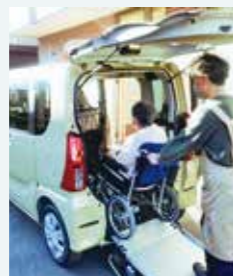
▲車いす対応の福祉車両