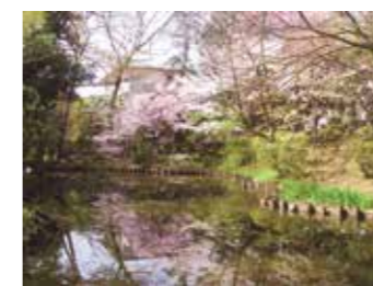
▲経堂五丁目特別保護区

みどりの豊かさと潤いを実感できるよう、みどりを守り、増やす取り組みを進めています。