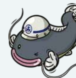
▲世田谷区防災キャラクター「じじよすけ」

地震や台風、甚大化する自然災害の発生に備え、いただいたご寄附は災害対策基金へ積み立て、災害時の円滑な応急対策や復旧のために活用します。もしもの時に備え、災害に強く、復元力を持つまちをめざします。