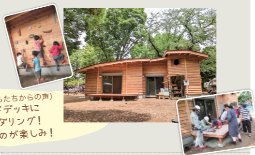
(子どもたちからの声) ウッドデッキに ボルダリング！ 遊ぶのが楽しみ！

みんなに長く愛されるリーダーハウスになるように、子どもの想いをカタチにしたリーダーハウスが完成しました。寄附金を活用させていただいたみんなが集えるウッドデッキや遊べる壁（ボルダリング）は、子どもたちや世話人のみなさんと一緒に作りました！