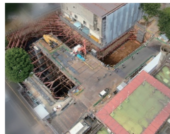
ドローンで撮影した工事現場の様子

新庁舎の工事は、予定していた地表から約17mまでの掘削を終え、いよいよ建物本体の基礎工事に着手しました。（令和4年6月末時点）