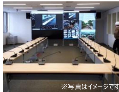
▲ 3 階オペレーションルーム