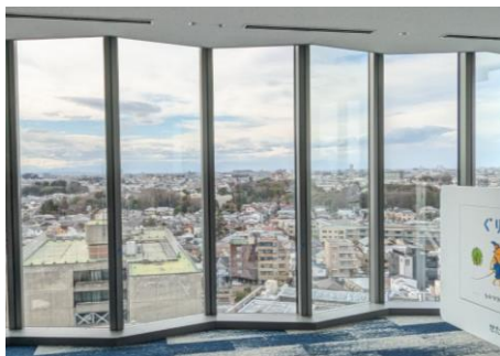
▲ 10 階展望ロビー