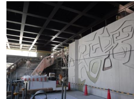
▲ 1 階エントランス