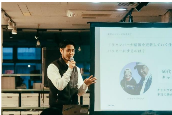
参加者によるピッチ

※各コースの最終プログラムとして、令和4年12月11日にピッチイベントを開催し、受講者自身がプログラムの成果としてビジネスアイデアを発表した。