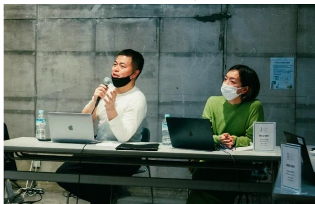
審査員からの講評