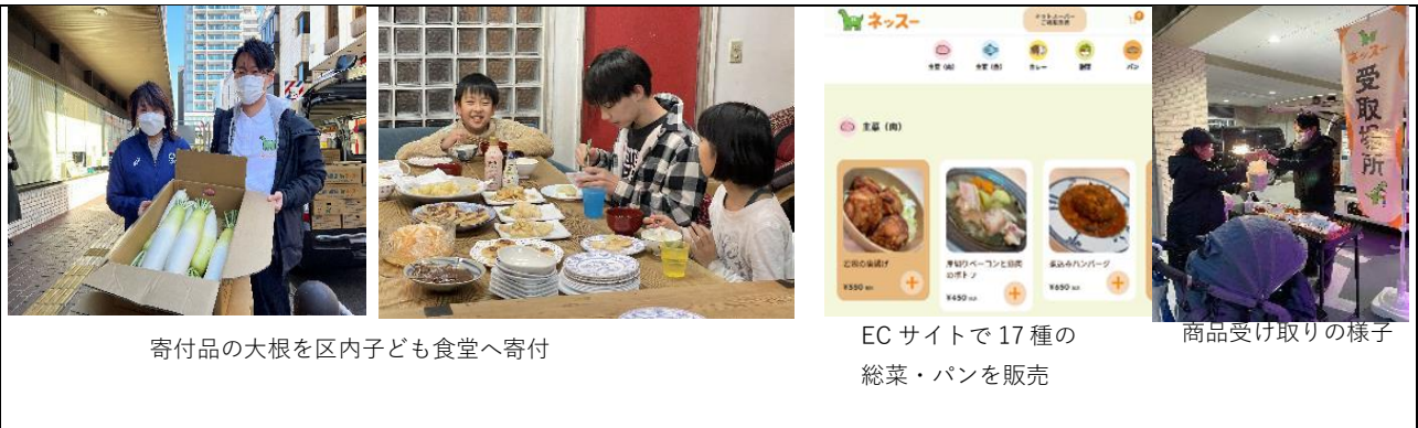
寄付品の大根を区内子ども食堂へ寄付