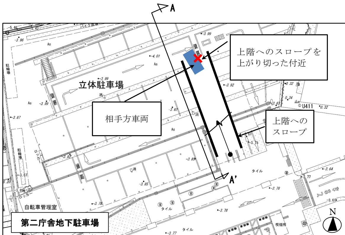
位置図（地下駐車場平面図）