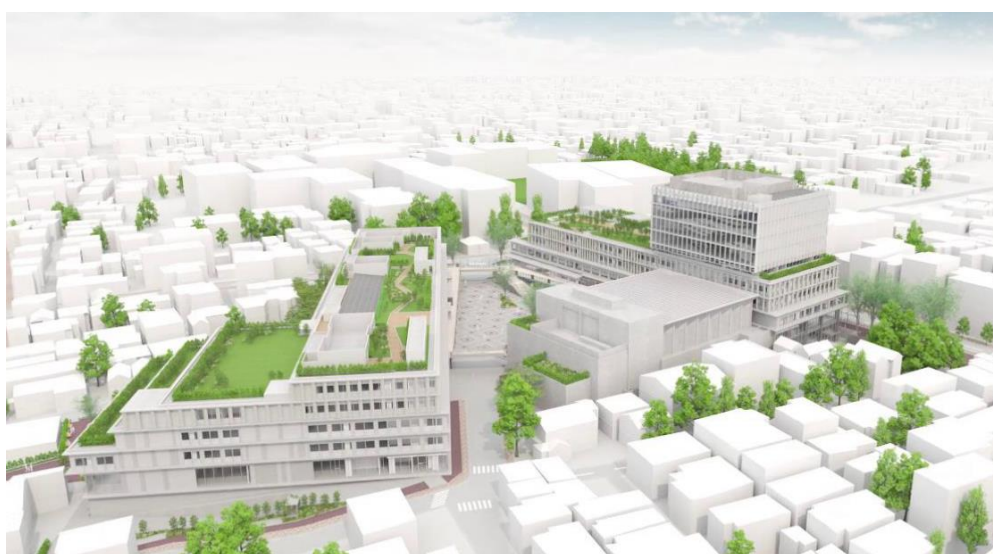
図：新庁舎の完成イメージ

このことから、本業務を委託するにあたり最適な事業者を選定するためにプロポーザル方式による選定を採用し、「世田谷区本庁舎等総合管理業務委託事業者選定委員会」を設置して優先交渉権者を選定するための審議を行ったので、その結果を次のとおり報告する。