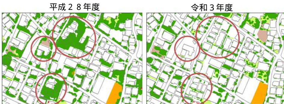
敷地細分化による緑被減少事例（喜多見四丁目）

独立住宅の敷地面積150㎡未満の敷地数は、平成23～28年調査、平成28～令和3年調査共に増加しており、引き続き敷地の細分化が進んでいることが分かる。150㎡未満の独立住宅で敷地数が特に増えているのは、110㎡未満のものであり、このような小規模な独立住宅では緑化余地がほとんどないため、小規模な独立住宅が増えることで緑被面積が減少することとなる。緑被率が比較的高い玉川地域、砧地域、烏山地域では、敷地の細分化が可能な屋敷林等を有する住宅地が多いため、緑被率の減少も大きくなっている。