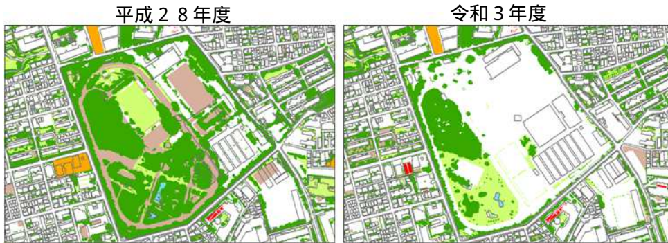
緑被の減少事例（JRA 馬事公苑）

平成28年からの5年間に、複数の敷地規模の大きい住宅団地やJRA馬事公苑、第一生命グラウンドなど、比較的規模が大きい敷地において、施設整備による樹木地や草地が減少した事例が多いことがあげられる。