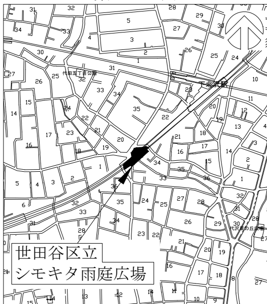
案 内 図