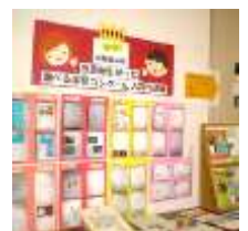
調べ学習コーナー