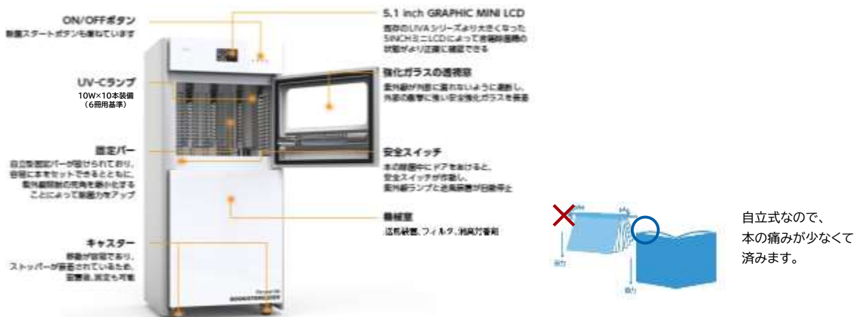
「LIVA」は全国の公共図書館を中心に約1,300館の導入実績があります。(2021年7月末現在)

新型コロナウイルス感染拡大に伴い、衛生意識や清潔志向が高まっています。来館者自身が自由に利用できるセルフ式図書除菌機「LIVA」の設置を提案します。約30秒で本に付着しているウイルスを紫外線で除菌するとともに、風によりホコリなどの異物を除去することができます。