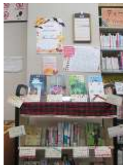
大学生ボランティア作成による ティーンズコーナーPOP図書紹介 弊社受託館事例

図書館を一緒に作り上げていくボランティアとして、近隣教育施設等の学生に協力していただきます。学生自身が考える図書館のイベントの企画や運営、ティーンズコーナーの選書やPOP作り、図書館の広報や企画や業務サポートなど、様々な活動にご参加していただきます。区民との交流だけでなく、学生自身の成長にも役立つ企画です。