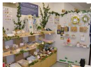
福祉作業所自主生産品の販売