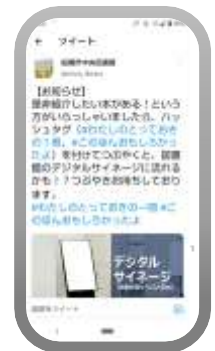
弊社受託館でのTwitter発信例

そのほか、天気予報、ニュースといった即時性ある情報もネットワーク経由で取得し、随時掲示することで、利用者に利便性の高い情報提供を行います。