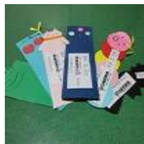
記念品付イベント