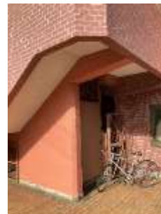
死角となるブックポストや駐輪場