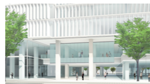
■東側ピロティのイメージ