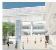
■西側ピロティのイメージ