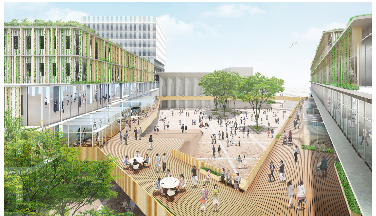
■区民の活動の舞台「世田谷リング」