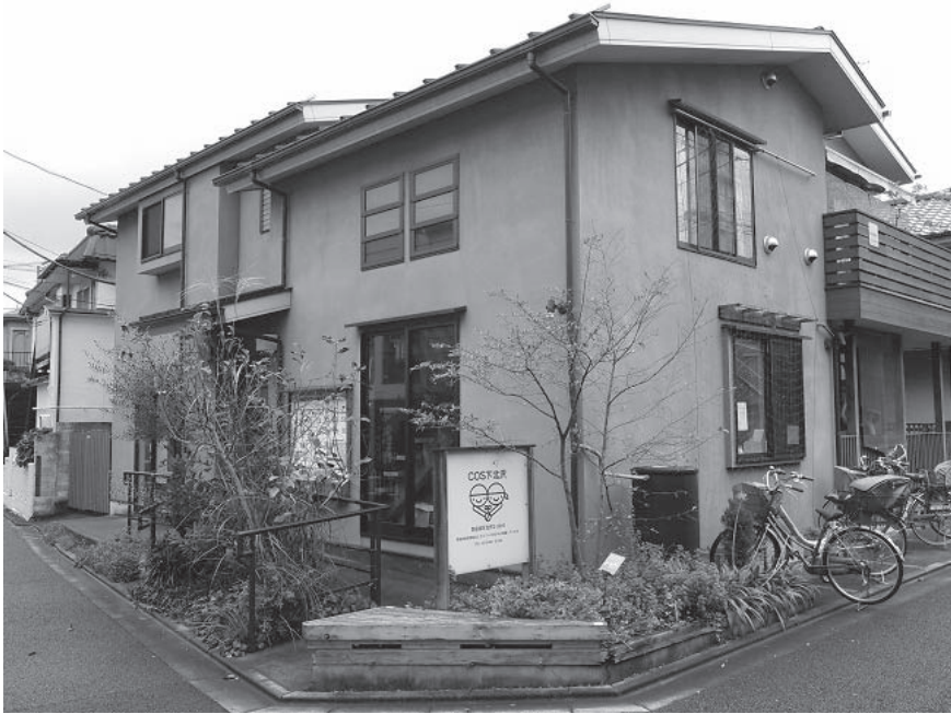
写真1 COS 下北沢の外観（2015年11月撮影）

グループ菜はCOS 下北沢に入居することでキッチンを一箇所に落ち着けることができ、従来から抱えていた懸案事項を解消することが出来た。ただし、以前よりも少し高い家賃を支払う必要がでてきた。それまでの事業だけでは家賃を支払うことが出来ないの、何か収入を増やす手立てを考えなければならない。そこで、COS 下北沢に入居した翌年から、おせちを作り始めた。今では毎年の恒例になっている。主婦が年末の忙しい時期に家を空けることになるので、初めは家族の理解を得るのが難しかったが、今では協力的になっている。おせちはとても好評で、地域の人だけでなく、クール宅急便で地方にも発送している。現在は、1人暮らしの人にも提供できるように、1人分のおせちも作ろうと考えている。このように、COS 下北沢への入居が新しい事業を始めるきっかけとなっている。