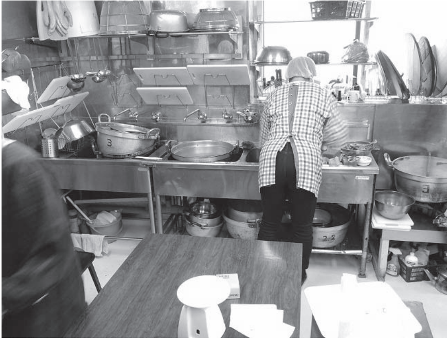
写真2 キッチンでの活動の様子（2015年11月撮影）

数年前にあんしんすこやかセンターを通じて活動を知ってもらう機会があり、そこから利用者を紹介してもらうことができた。当初は母親たちのための配食サービスとして始まったが、現在は高齢者の利用もある。今後の展望としては、COS 下北沢にはキッチンも集まって食事できるスペースもあるので、子ども食堂のようなことをしたいという思いがある。ただ、子どもたちが集まるかどうか見通しが見えない。より可能性がある展望として、1人で食事をしている人が集まるサロンのような食事会をするのも良いと考えている。