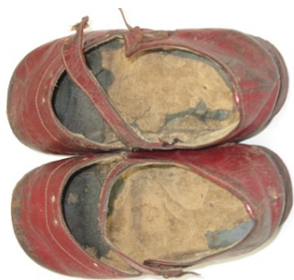
さけ 鮭の皮で作った靴(昭和18年)