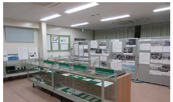
多目的室での常設展示(12月19日～3月14日)