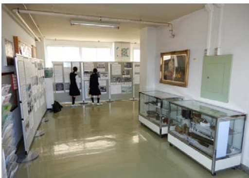
中学校巡回展の展示のようす

展示パネルを見て、自分の身近な場所が昔、被害にあったということで、都民として考えることができました。また、自分達と同じような年齢の子どもたちが戦争のときどのように過していたのかなど勉強になりました。(中学校生徒)