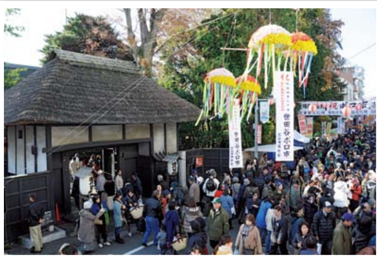
430年を越える歴史を持つ 世田谷のポロ市