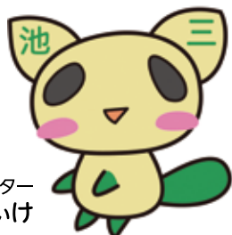
池尻地区キャラクター みいけ

大地震等災害に対しては向う三軒両隣の助け合いが、犯罪のないまちには多様な団体のネットワークが、また、高齢者や要介護者の支援には地区の支えあいが、欠かせません。このように、人びとが助け合い、多様なコミュニティが相互に連携するまちづくりを進めます。