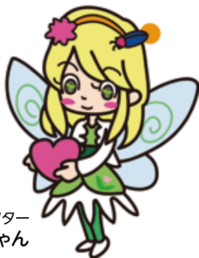
若林地区キャラクター わかゆちゃん

介護予防と健康づくり施策の効果的な事業連携を推進します。また、様々な団体による支えあいや見守り活動を連携により展開し、まちの誰もが信頼しあえる心優しいまちづくりを推進します。