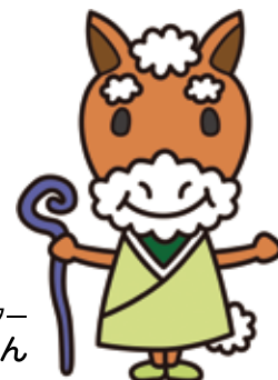
上馬地区キャラクター かみじいさん

各種団体のネットワークを強化し、災害時に助け合えるまちをめざします。高齢者や子どもたちを地域全体で見守り支えあうやさしいまちを作っていくとともに、まちの緑化を進め、あらゆる世代が交流できる活気あるまちをめざします。