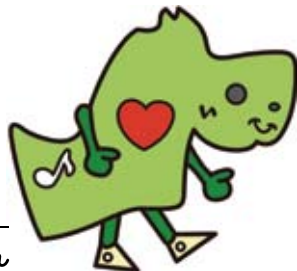
経堂地区キャラクター お経ちゃん

経堂・宮坂・桜丘で生活していて心が安らぎ、住み続けたいと思えるまちであるためには、子どもからお年寄りまで誰もがいきいきと暮らせる環境・態勢を作っていかなければなりません。日頃からの人と人とのつながりや人を思いやる気持ちが災害時にも大きな力となります。現在、地域活動の基盤となっている町会を中心に、より多くの地域住民や地域活動団体がつながっていくために、さまざまな機会をとらえ交流し、絆を強めていきます。