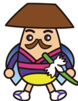
上町地区キャラクター 代官ホタルン

大場家代官屋敷（国重要文化財）と世田谷のポロ市（都無形民俗文化財）に象徴される歴史や文化のまちとして、ポロ市を継承しながら、まちの活性化と地域住民の交流の場となるまちをめざします。