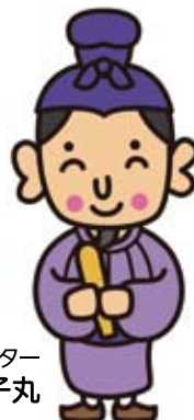
太子堂地区キャラクター 太子丸

まちの緑化を進めるとともに、太子堂・三軒茶屋らしい歴史・文化・産業を育み、未来につなげます。