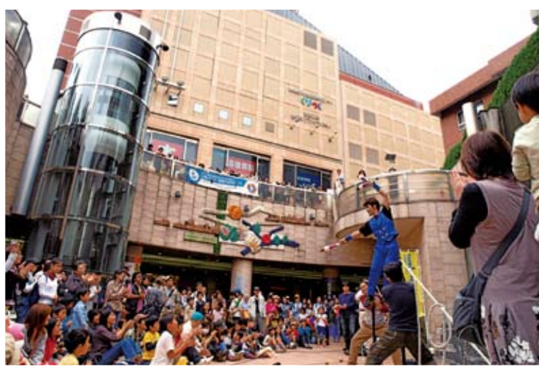
世田谷アートタウン三茶de大道芸の様子