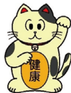
”北沢健康まねきの会” のキャラクター