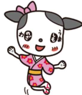
下馬・野沢地区キャラクター しものざワン

学校、保護者、地域住民が一体となって、子どもたちの健やかな成長を育むとともに、健康増進に関する活動やイベントを通じて、誰もがいつまでも元気でいきいきと暮らせるまちをめざします。