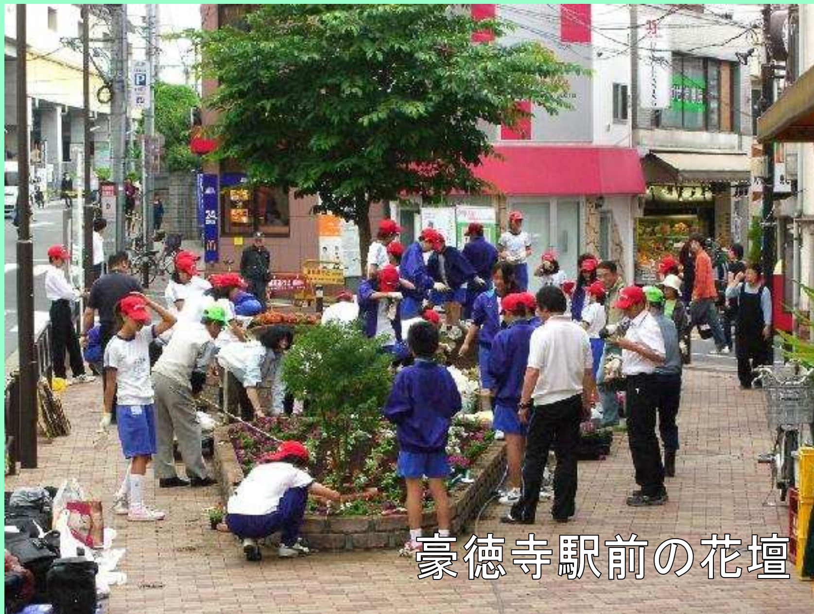
豪徳寺駅前の花壇