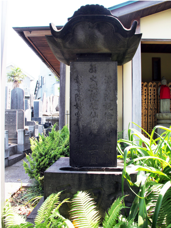
■太田卯兵衛夫妻および同後妻の墓（医王寺）