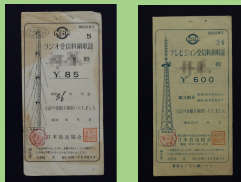
■ラジオ受信料領収証・テレビジョン受信料領収証 (昭和36年)

区では、皆様のお宅に眠っている資料を発掘、収集し、地域に生きた人々の暮らしぶりが活き活きと伝わる区史にしたいと考えております。また、戦時中の体験談などを皆様に直接伺い、