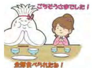
全部食べられたい!