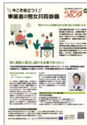
▲今こそ役立つ! 事業者の男女共同参画(令和3年3月発行)