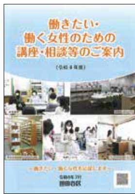
▲働きたい・働く女性のための講座・相談等のご案内(年1回発行)