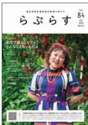
▲男女共同参画情報紙「らぶらす」(年2回発行)