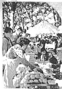
新潟の松代町から

受付をみ切っても希望が殺到! 3頭のりっぱな馬は一日の乗馬人数、乗馬時間が限られているそうです。 お馬さんも 疲れちゃうんですね。 体験出来なかった人は 次の機会にどうぞ。