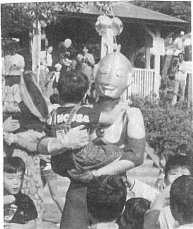
(ちびっこコーナー)