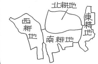
千歳村の頃 (明治中期～昭和初期)

江戸時代は村高八十五石余、家敷三千軒、用水は品川用水を用い、村の東に御林山があった。小名には水無、世蔵堂前、