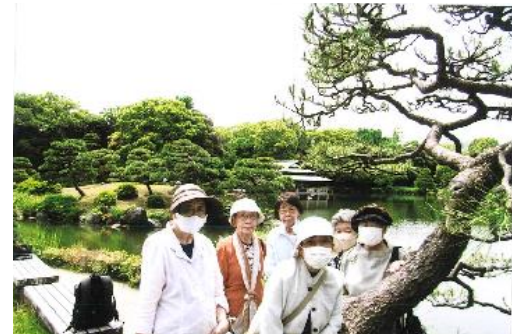
▲5月は都営交通で江東区の清澄庭園へ

「歩行会」は、希望ヶ丘団地の高齢者クラブの部会の一つです。モットーは、みんなで元気に・楽しく・朗らかにまち歩きを楽しむこと。去年はコロナ禍の影響で活動を自粛しましたが今年は徐々に再開。2月は羽根木公園、3月は砧公園、4月は次大夫堀公園、5月は清澄庭園、6月は芭蕉記念館へ。問い合わせ先・代表柏倉090-1666-7194。