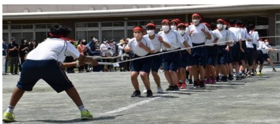
▲1年生の大縄跳び。3年生はフナキボ記録を 更新し、99回を記録(船橋希望中学校)