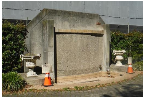
▲水が止められた壁泉