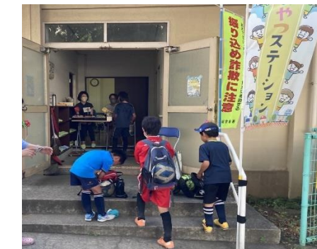
▲入れ替わり立ち替わり子どもたちがやります。

船橋4丁目住宅の集会所にて、開催日は不定期、時間は15時半~17時半開催。問い合わせ先 船橋まちづくりセンター