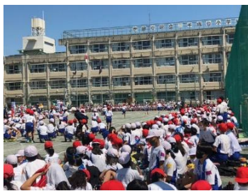
◀校庭に響いた 徒競走への大歓声！ (千歳台小学校)