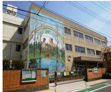
▲見納めとなる壁画

今後はご遺族の了解の上で、モザイク画をメモリアルプレート化し校舎昇降口付近に設置する予定です。