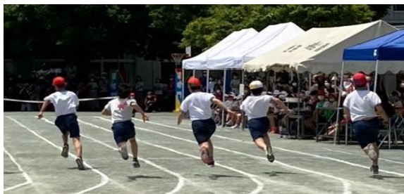
▲空を飛ぶかのような6年生の徒競走 (船橋小学校)