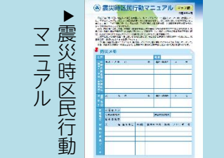
▶震災時区民行動 マニュアル