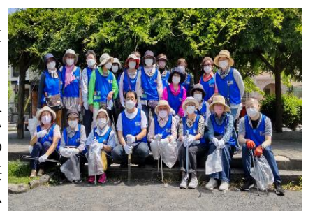
▲船橋葎根会、希望ヶ丘団地自治会そろって出陣！

区の「せたがやクリーンアップ作戦」参加事業として、各町会・自治会が「ごみ0(ゼロ)デー」に取り組みました。千歳台廻澤町会は5月29日に実施。船橋会は5月30日に千歳船橋駅前広場から神明神社を、小中高生も一緒に清掃。6月5日、船橋葎根会と希望ヶ丘団地自治会は共同で船橋5~7丁目界隈までを清掃し、4人の小学生が飛び入り参加。次世代の町の担い手への期待も膨らむ「ごみ0デー」となりました。