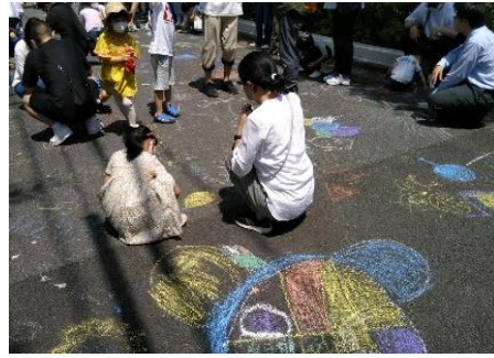
▲チョークで路上におえかき