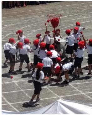
◀かわいい1年生の玉入れ (希望丘小学校)

今年は船橋小学校、希望丘小学校、千歳台小学校が5月28日(土)に、船橋希望中学校は6月5日(日)に開催。どの学校も、観客数の制限、時間の短縮化、プログラムのスリム化などの工夫を重ねたそうです。梅雨晴れの日、全力で演技や競技に取り組む姿が見られました。