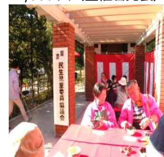
お茶席で談笑する人たち

第1回から恒例の民生児童委員協議会のお茶席も、行列ができる盛況ぶり。今年も、委員さんが心をこめて点てた薄茶と上品な甘さのじょうよまんじゅうが人気でした。緋毛氈(ひもうせん)におかれた野の花を愛でながら、心も体も癒されるひとときを多くの方が楽しんでいました。