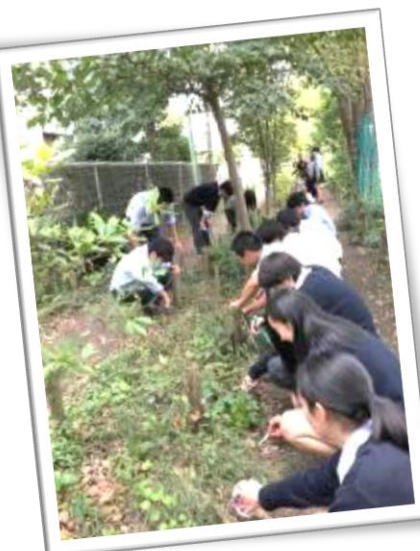
2学期、草のカット*に取り組む生徒たち

*昆虫など生きもの の隠れ場所確保と 生物多様性の観点 から、小径では5 センチの高さで草 をカット