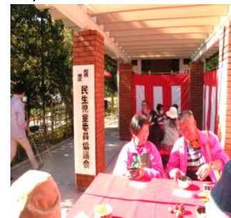
お茶席で談笑する人たち

第1回から恒例の民生児童委員協議会のお茶席も、行列ができる盛況ぶり。今年も、委員さんが心をこめて点てた薄茶と上品な甘さのじょうよまんじゅうが人気でした。緋毛氈(ひもうせん)におかれた野の花を愛でながら、心も体も癒されるひとときを多くの方が楽しんでいました。