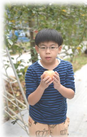
果樹園の隣には公園もあります お弁当を持ってりんご狩りも楽しいですよ