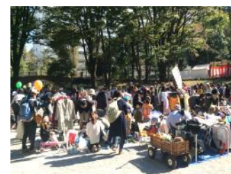
買い物客でにぎわうフリーマーケット会場

11月3日(祝・土)、模擬店、ステージでの演技、フリーマーケット、こどもきっさ、餅つき、野菜販売などで、多世代の方が親睦を深めました。はしご車体験コーナーの消防車が公務のため出動する一幕もありましたが、帰還して無事実施されました。改修工事が終わった希望丘公園には、17,000人(主催者発表)もの人が集まりました。