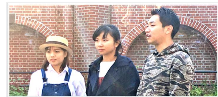
希望丘公園の壁泉の前で動画撮影中の学生たち

マップと動画のお披露目イベントは3月3日(日)に開催予定。その後、ウォーキングマップとサポートブックは船橋まちづくりセンター等で、無料でもらえます。街歩きにご活用ください。