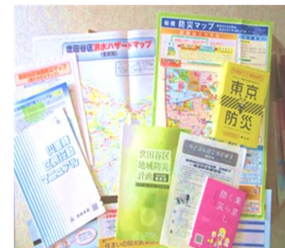
マニュアルやマップ等各種防災資料はまちづくりセンターで配布しています