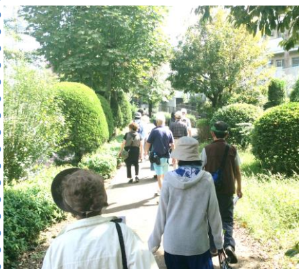
緑いっぱい鳥山緑道(船橋と経堂の境界)

出発は千歳船橋駅前広場。かつて品川用水だった千歳通りと環八の交差点付近には、稗穀橋(ひえがらばし)が架かっていたそうです。千歳台の島田農園では、戦後活躍したというオート三輪や製粉機を見学しました。