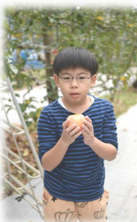
果樹園の隣には公園もあります お弁当を持ってりんご狩りも楽しいですよ