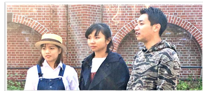
希望丘公園の壁泉の前で動画撮影中の学生たち

マップと動画のお披露目イベントは3月3日(日)に開催予定。その後、ウォーキングマップとサポートブックは船橋まちづくりセンター等で、無料でもらえます。街歩きにご活用ください。