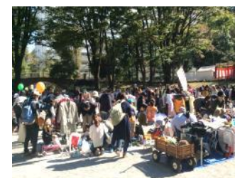
買い物客でにぎわうフリーマーケット会場

11月3日(祝・土)、模擬店、ステージでの演技、フリーマーケット、こどもきっさ、餅つき、野菜販売などで、多世代の方が親睦を深めました。はしご車体験コーナーの消防車が公務のため出動する一幕もありましたが、帰還して無事実施されました。改修工事が終わった希望丘公園には、17,000人(主催者発表)もの人が集まりました。