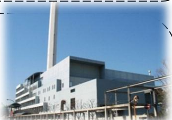
煙突は高さ130メートル

*個人見学会(9月以降は問い合わせを) 7月22日(土)13時30分~15時 8月26日(土)13時30分~15時 見学日の2日前までに電話でお申し込みください。先着50名。 *団体見学(10名以上) 受付開始時期をホームページで確認の上 見学希望日の1週間前までに電話でお申し込みください。 http://www.union.tokyo23-seisou.lg.jp 申込先電話:03-3302-2592 備考:バリアフリー対応相談可