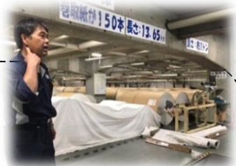
紙庫いっぱいのロール紙は一日分

朝日プリンテックは朝日新聞社の印刷工場です。カラー印刷技術は世界一、毎日朝刊46万部、夕刊13万部を生産しています。また向かい側の大きな煙突は千歳清掃工場のシンボル。高さは130メートルあり、高温で酸素濃度が薄い排気が近隣の建物にかからないようにするため高くなっているそうです。まだまだ奥が深い工場内部、どちらにも90分の工場見学プログラムがあります。一度、見学されてはいかがでしょうか。