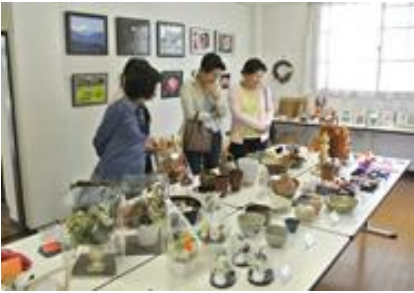
力作を鑑賞する皆さん。

スタッフの皆さんは「隠れた才能を発見でき、初対面の人たちとのふれあいの場になった」「仕舞い込んでいた作品を多くの方に見ていただき、出品者は喜んでいるでしょう」と語ってくださいました。