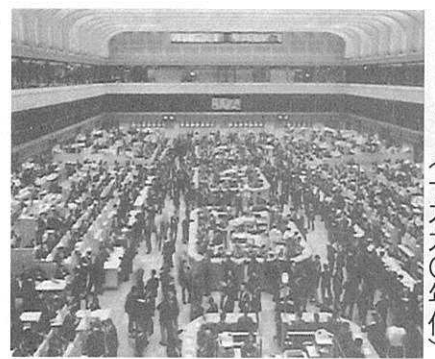
▲立会場での売買風景 (一九九〇年代)