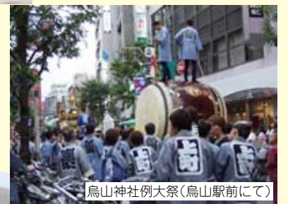
烏山神社例大祭(烏山駅前にて)