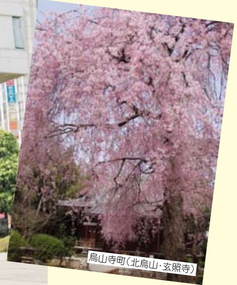
烏山寺町(北烏山・玄照寺)