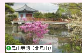
1 烏山寺町 (北烏山)