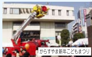
からすやま新年子どもまつり