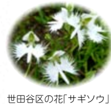
世田谷区の花「サギソウ」