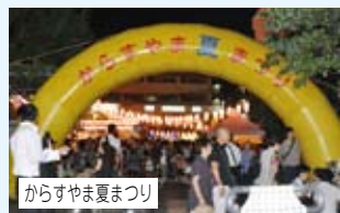
からすやま夏まつり