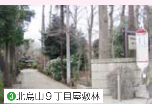
3 北烏山9丁目屋敷林