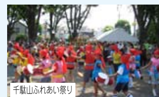
千駄山ふれあい祭り