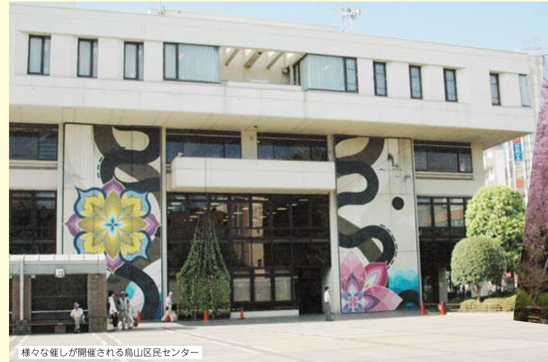
様々な催しが開催される烏山区民センター

このマップは、「地域の絆再生支援事業補助金」で作成しています。平成22年12月1日 第2版発行