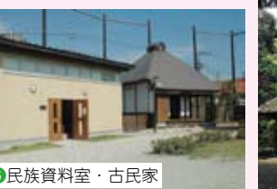
6 民族資料室・古民家