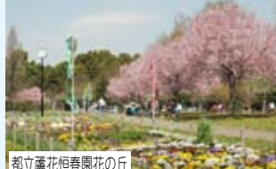
都立蘆花恒春園花の丘

※イベント等は日時が変更となる場合もありますので、区報や区覧板等でご確認ください。