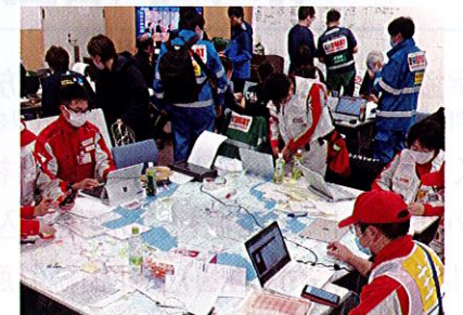
被災地の情報収集を行う赤十字救護班と各関係機関(令和6年能登半島地震)

災害時、赤十字は国の指定公共機関として、自治体をはじめとする関係機関と密に連携し、一刻一刻と変化する被災地ニーズに応じた支援を行っています。