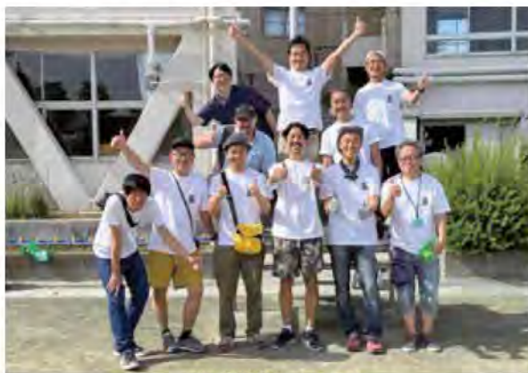
玉堤小学校おやじの会 玉堤小学校運動会のお手伝いで日焼けしたおやじたち

玉堤小学校には、おやじの会があります。どんな活動をしているのか気になりますよね? スローガンの「子どもたちの笑顔のために」限られた時間の中で活動を行っています。