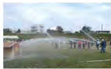
昭和36年の尾山台商店街

学校や地域の皆さま、そしてこの街を育てていく子どもたちとの繋がりを大切にしながら「玉堤小おやじの会」は引き続き活動していきたいと思っています。あらためて「子どもたちの笑顔のために」