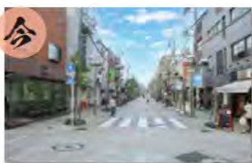
昭和36年の尾山台商店街

今昔シリーズ「尾山台の商店街」 昭和36年頃の尾山台商店街です。当時は路線バスも通る商店街でした。その後、何度かの改修を経て現在のハッピーロード尾山台へと発展してきています。現在の尾山台地区会館の辺りから尾山台方向の風景です。