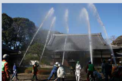
文化財防火デー消防演習

消防団は、学生・会社員・自営業者・主婦など様々な方が集まって活動しています。近年は女性の団員も増え、それぞれの得意分野を生かしながら活躍されています。皆さんも消防団に参加して、大切なまちを一緒に守っていきませんか。