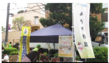
食支援を通じた関係づくり