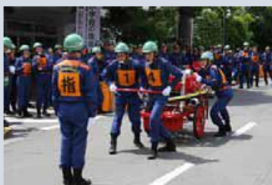
世田谷消防団消防操法大会