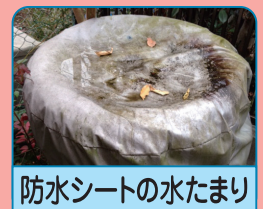
防水シートの水たまり