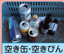
空き缶・空きびん