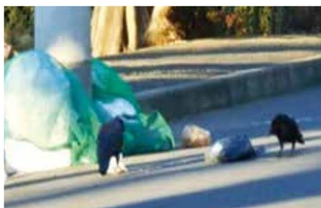
(ごみを漁るカラス)