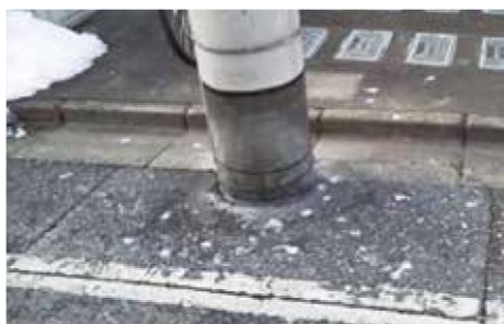
(ふんで汚れた道路)