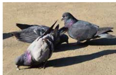
(エサを食べるハト)