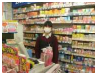
↑ 中学2年生の職場体験の例