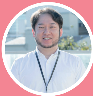
社会福祉法人 菊清会さくらしんまち保育園 園長