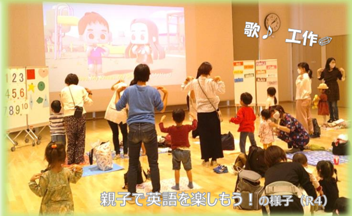
親子で英語を楽しもう！の様子 (R4)

1学期の開催日は、5/20、6/17、7/22、8/5です。 (いずれも土曜日)