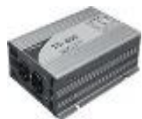
インバーター装置