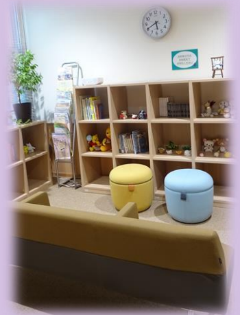
(写真)教育相談待合室