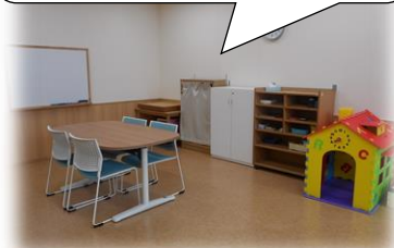
(写真)プレイルーム