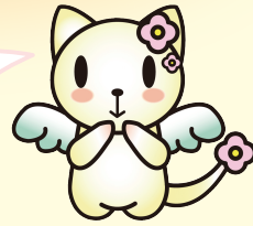
マスコットキャラクター なちゅ

ひとりがんばらなくて いいんだよ あなたからのはがき、待ってるね！ そのほかに 電話、メール、手紙、FAX、 会っても相談できるよ ひみつはまもるから安心してね