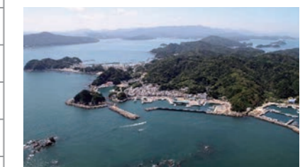
▲ 修学旅行(三重県答志島)