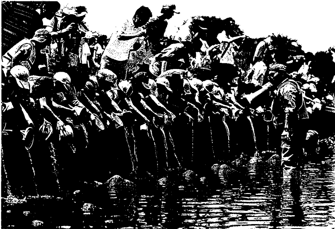
「多摩川春のあゆ祭り」では、「大きくな〜れ」の掛け声とともに子どもたちが一斉にアユを放流