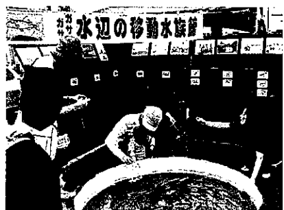
移動水族館では実際に魚に触れて「命」を体感する

トを着て多摩川を泳ぐ体験から、水の事故防止に役立てる「夏休み多摩川教室」を10年以上続けています。こうしたイベントでは、川での楽しい遊びとともに、川をきれいにするため家でできることや、外来種が生態系に与える影響も一緒に考えてもらっています。さらに、一人で川に行つてはいけないことや、もし川に落ちたらどうすればいいかなど、ユーモアを交えながら安全の基本を学んでもらいます。