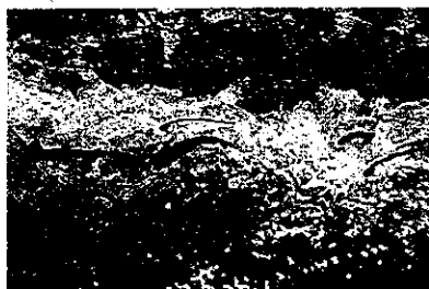
かつて「死の川」とまで言わ れた多摩川には、現在、春に 数百万匹のアユが遡上する