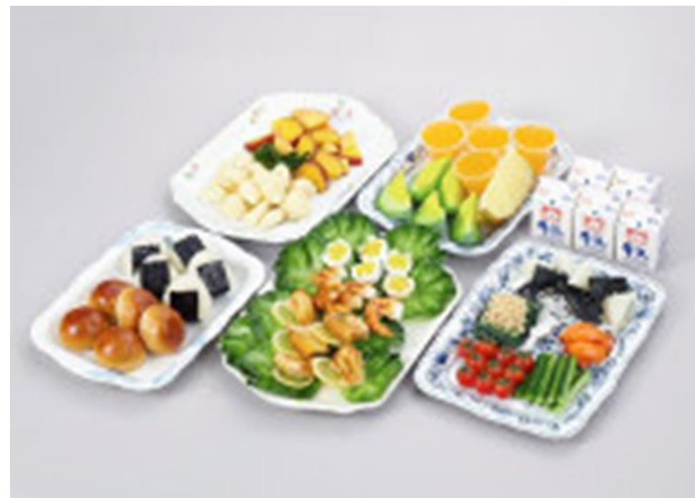
バイキング給食(1)おにぎり、小型パン(2)鶏の香味焼き、ゆで卵、えびのから揚げ(3)にんじんグラッセ、ほうれん草ピーナッツ和え、昆布とこんにゃくの煮物、プチトマト(4)粉ふきいも、さつまいものから揚げ(5)くだもの(メロン、パイナップル)、ゼリー、牛乳

平成元年『小中学校学習指導要領』が改正されたことを機に、学校給食は「特別活動」の中の「学級活動」に位置付けられる。