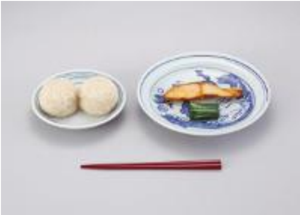
明治24年:おにぎり二個、塩鮭1切れ 菜っ葉の漬物

明治の半ば、山形県の小学校で、貧困児童を対象に、無料で学校給食を実施したことが始まり。