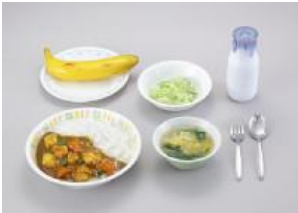
昭和52年：カレーライス、牛乳、塩もみ、くだもの(バナナ)、スープ

平成元年『小中学校学習指導要領』が改正されたことを機に、学校給食は「特別活動」の中の「学級活動」に位置付けられる。