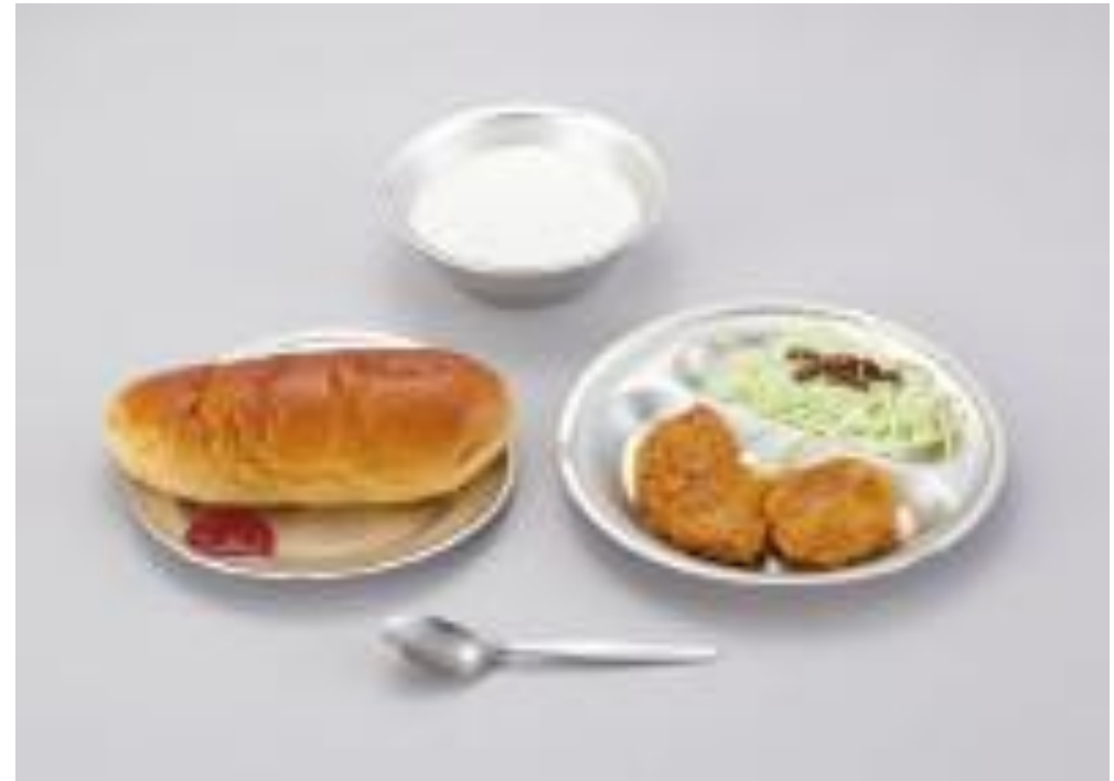
昭和27年:コッペパン、脱脂粉乳、 鯨肉の竜田揚げ、せん切りキャベツ、ジャム

戦後、児童、生徒の栄養補給を目的に学校給食の方針が高まる。 アメリカなどの食料援助による小麦粉などの導入で、パン、脱脂粉乳などを配給。