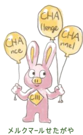
メルクマールせたがや