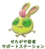
せたがや若者サポートステーション

※メルサポは世田谷若者総合支援センターのメルクマールせたがやとせたがや若者サポートステーションが共同で運営しているプログラムです。