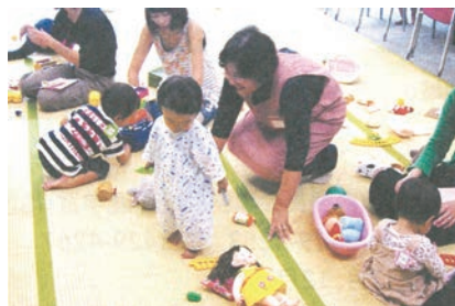
▲子育てサロン「おおきくなあれ」