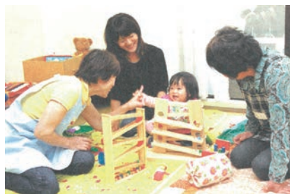
▲子育てサロン「トコトコ」