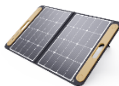
小型ソーラーパネル