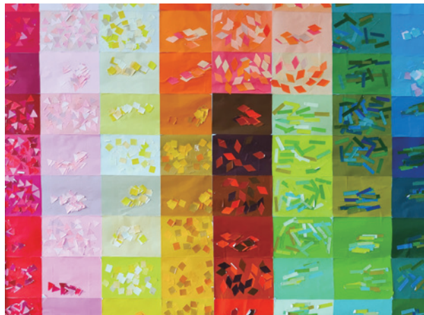
▲世田谷区立給田福祉園 イエロー班作成