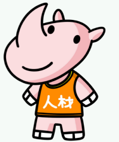
世田谷区福祉人材育成・研修センターのマスコット「じんざい君」

臨床心理士や社会保険労務士などによる悩みごと相談(メール、面談)も、無料で行なっています。また、介護施設の見学会や福祉のしごと入門講座、相談・面接会なども、開催しています。