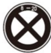
No Parking or Stopping 駐車車禁止