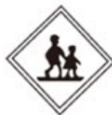
School Kindergarten, Nursery School Zone 学校・幼稚園・ 保育所等あり