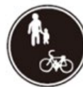
Bicycles and Pedestrians Only 自転車及び歩行者 専用