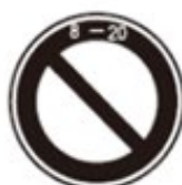
No Parking 駐車禁止