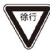
Slow Down 徐行