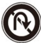
No U-turn 転回禁止