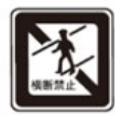
No Pedestrian Crossing 歩行者横断禁止