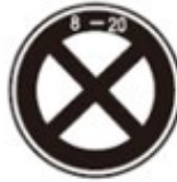
No Parking or Stopping 駐停車禁止