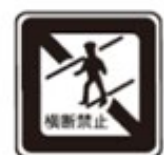
No Pedestrian Crossing 歩行者横断禁止