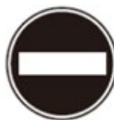
Vehicle Entry Prohibited 車両進入禁止