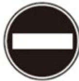
Vehicle Entry Prohibited 車両進入禁止