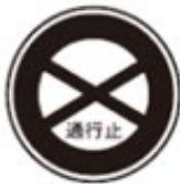
Road Closed 通行止め