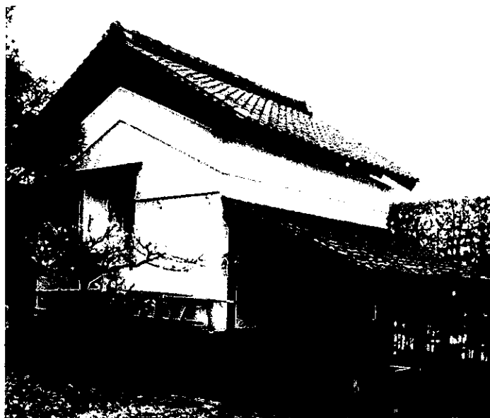
写真1 旧浦野家住宅土蔵・全景（岡本公園民家園内）