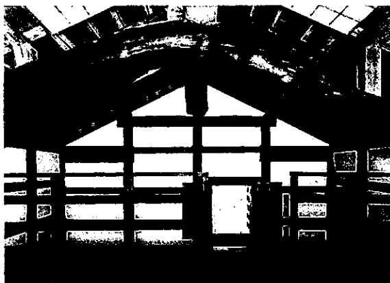
写真2 2階内部と梁組

構造は、布石の上に土台を置き、平側で3尺間、妻側で3.75尺間に柱を立て、両妻側の天秤梁と中央の曲り梁に渡された牛梁（地棟）に、登り梁をそれぞれ架けて棟木を支えています。この巨大な自然木の松材を巧みに利用した曲り梁が優れた意匠となり、これを用いて牛梁を受けている構造がこの土蔵の特徴といえるでしょう。