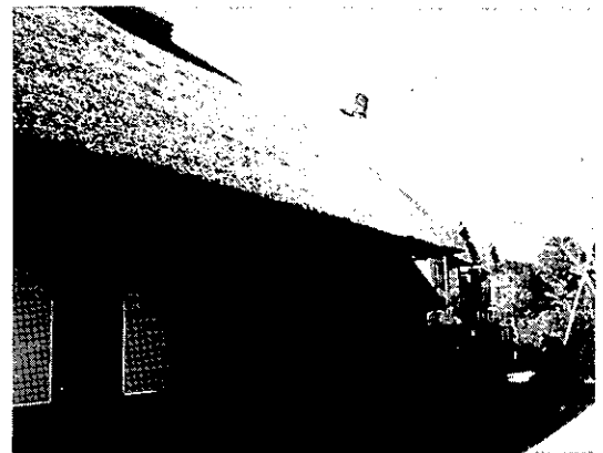
コト八日の日の目籠(次大夫堀公園民家園)

このように、日常の生活から離れて、神祭りをするのにふさわしい清らかな心身になることが「ミカワリ（身変わり）」だったのです。それがやがて妖怪の名前に変化してしまったようです。