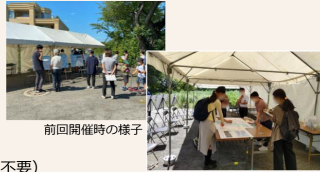
前回開催時の様子

上用賀公園拡張計画地において、計画の説明パネルを設けたブースを設置し、実際に現地を見ていただきながら、担当者がその場でご意見をお伺いいたします。